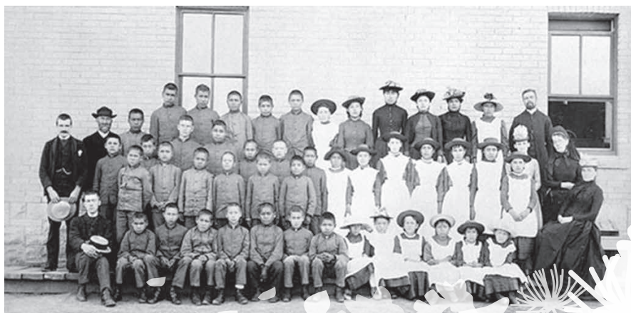
© Crédit : La bibliothèque et les Archives le Canada, ID PA-182251 « Étudiants autochtones du pensionnat indien (école des métiers) St. Paul ».